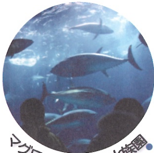
マグロ / 葛西臨海水族園