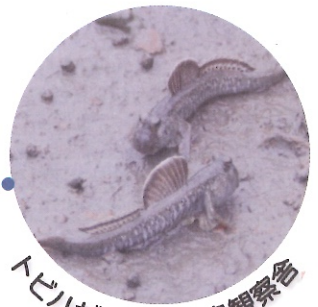
トビハゼ / 行徳野鳥観察舎