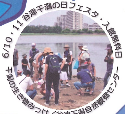
6/10・11 谷津干潟の日フエスタ・入館無料日 土曜日の生き物みつけ / 谷津干潟自然観察センター