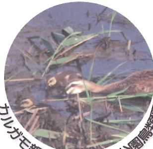
カルガモ親子 / 葛西臨海公園鳥類園