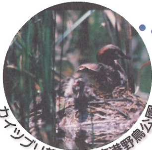
カイツブリ親子 / 東京港野鳥公園